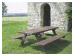
Table «H» plateau