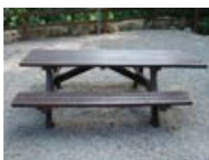
Table «H» 240cm