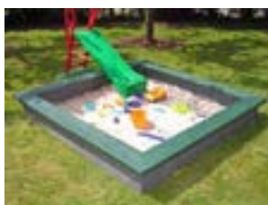
Bac à sable massif