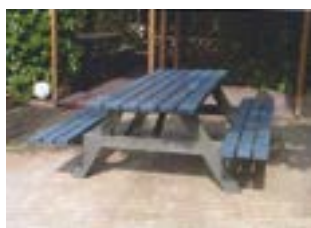
Table «H» 200cm