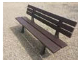
Banc pieds en fonte