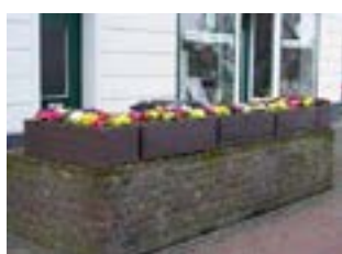
Eve ou Lise