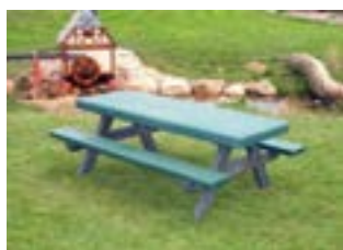
Table enfant vert